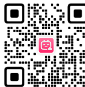
RIGOL B 站账号